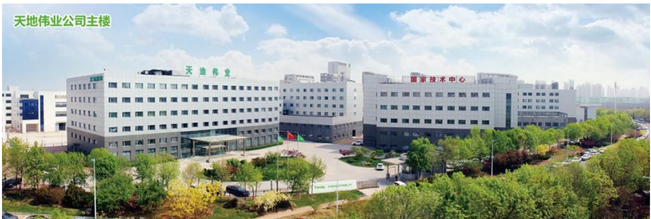
图 1 天地伟业公司全貌

天地伟业技术有限公司是全球领先的智能安防解决方案提供商,基于人工智能、大数据、云计算、物联网等技术,为公安、政法、交通、金融、教育、环保等行业提供智能视频产品、系统解决方案及优质技术服务。天地伟业以“视界为世界”作为企业使命,产品远销全球 60 多个国家和地区,是全球安防前 10 强。公司在全国设立 40 余个分支机构和服务中心,连续十七年荣膺“中国安防十大品牌”,产品应用在北京天安门、中国运载火箭试验中心、达沃斯论坛,伦敦希斯罗机场、公安部监管中心、中国农业银行总部,以及天津、上海、西安、郑州、厄瓜多尔首都、塔吉克斯坦首都等 500 多个智慧城市。