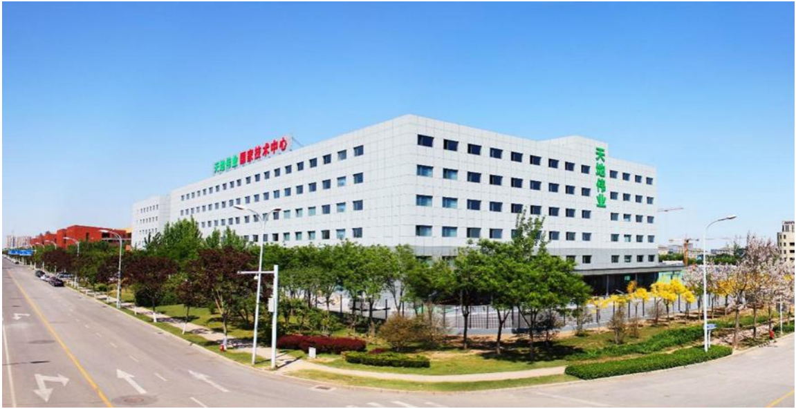
图 2 天地伟业技术有限公司生产基地